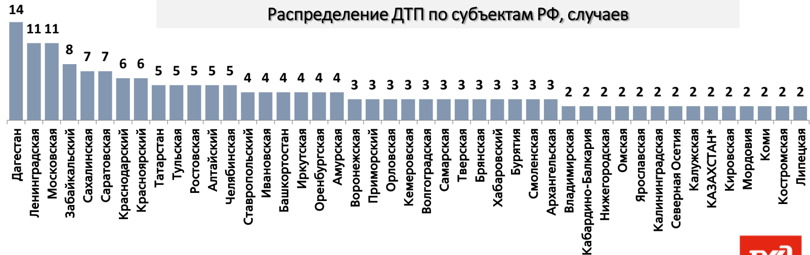
Распределение ДТП по субъектам РФ, случаев